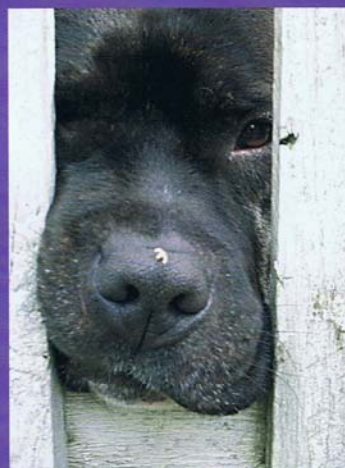
Nyflken och pahittig, vill alltid vara med där någonting händer.

Jaktlusten hos rasen är mer individuell än rasbunden. Hos vissa individer är den stor, och hos andra liten. De flesta är dock intresserade av småvilt, som möss och grodor, men för den skull behöver