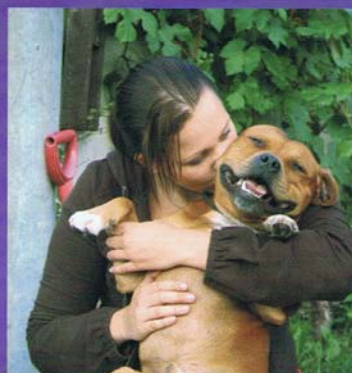
En leende knähund, som älskar människor.