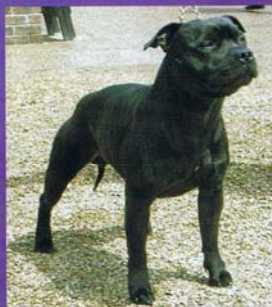
Svarbrindle, med eller utan vita tecken, är idag den vanligast förekommande färgen i Sverige.