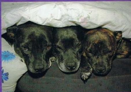
Det ska vara mjukt, varmt, och gärna lite trångt, då trivs vi.

Ibland kan det upplevas som om en Staffe har svårt att lära in saker, men det är ofta på grund av att den vill så mycket, och har så bråttom. Då krävs