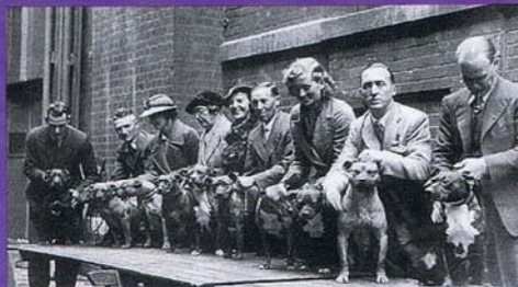
Utställning i England 1937.

ras. En minskning av immunologiska sjukdomar är det som nämndes som viktigast att arbeta med. Förekomsten av HD och AD katarakt/PHPV samt förlossningskomplikationer finns, men upplevs inte vara något övergripande problem.