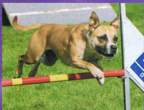
På bilden ses Pippi hoppa över ett Agilityhinder. På SM 2006 placerade hon sig på en 4:e plats, hon är även kvalificerad till SM 2007.

det att den som tränar hunden ger tydliga signaler och är otroligt snabb och exakt med berömmet.