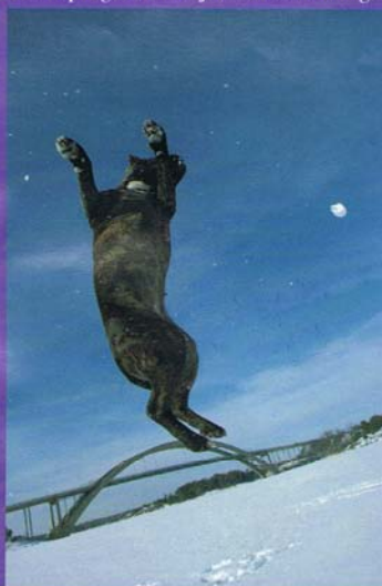
Spänstig och snabb. Hoppar med lätthet högt, och rakt upp i luften.

med på allt och inte vill missa någonting. Blir den lämnad ensam under längre perioder finns en stor risk att ditt hem inte längre är i det perfekta skick du lämnade det i. En hundkompis kan aldrig mäta sig med en människa när det gäller sällskap för en staffe.