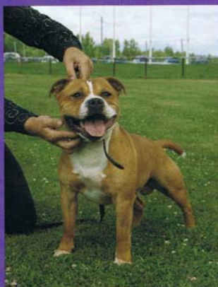
Staffordshire bull terrier är en stor ras i utställningssammanhang.